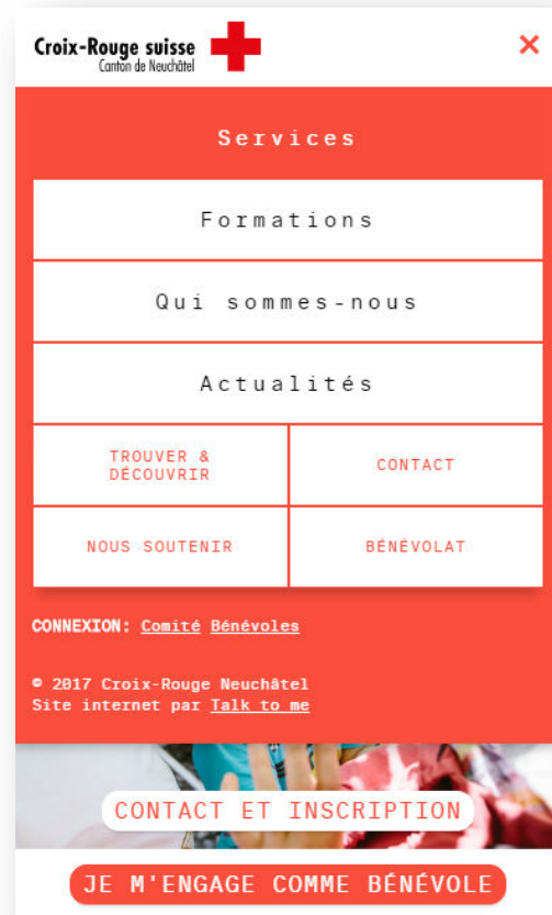
Capture : Menu sur smartphones