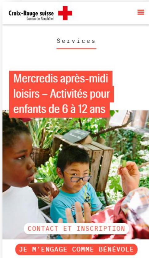
Capture : Mercredis après-midis loisirs