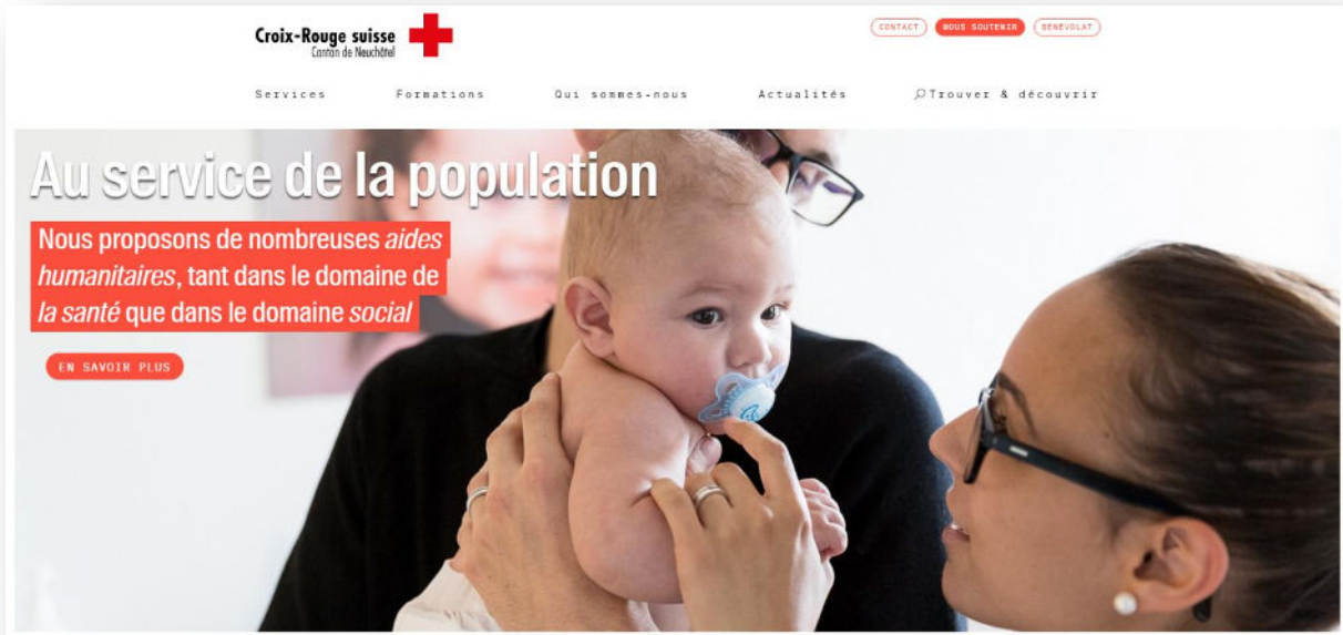
Capture : Page d'accueil